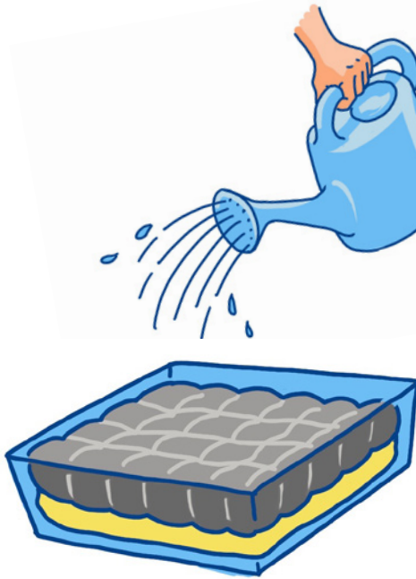
Pflasterfläche (z.B. Gehweg oder Hofeinfahrt)

Alternativ wurden spezielle Materialmischungen entwickelt, die als Öko-Pflastersteine ein erhöhtes Versickerungsverhalten auch bei flächendeckender Pflasterung ermöglichen.