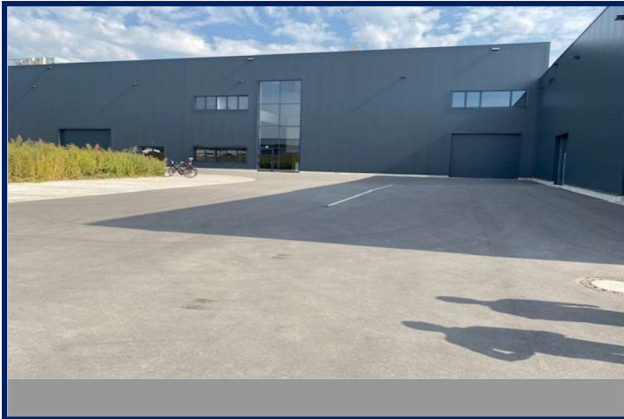
Überflutungsraum in der befestigten Fläche mittels Dreiecksprofil und Entwässerungsrinne.