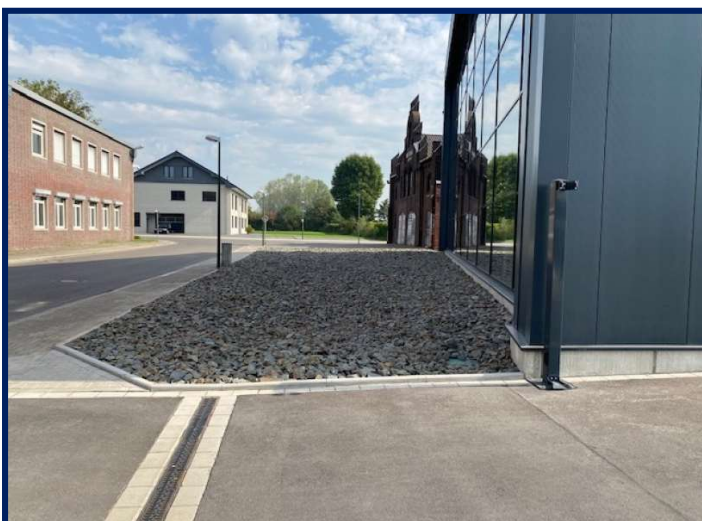
Schottermulde als Überflutungsfläche.